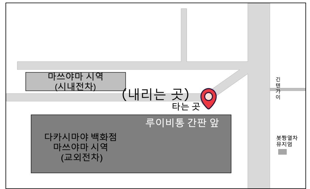
마쓰야마시역 앞(승/하차 동일)