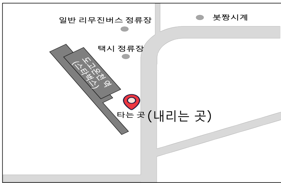
도고온천역 (승/하차 동일)